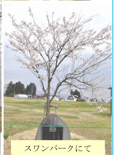
スワンパークにて