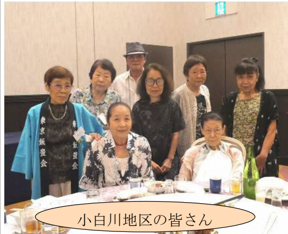
小白川地区の皆さん