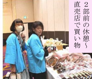
2部前の休憩 直売店で買い物