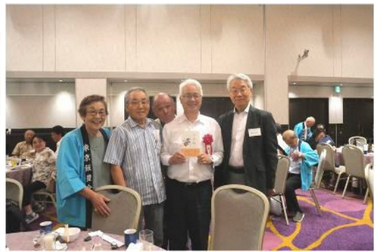
総会出席者と記念に