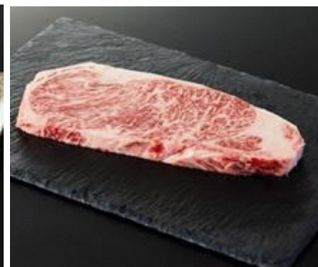
ステーキ用 (一人前)