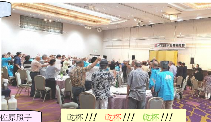
乾杯!!! 乾杯!!! 乾杯!!!