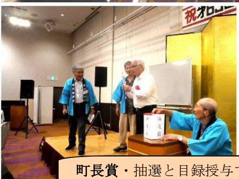
町長賞・抽選と目録授与でバンザイする!!