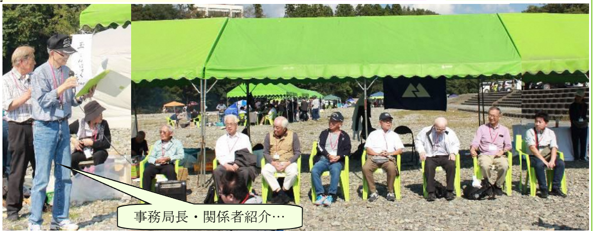
事務局長・関係者紹介…