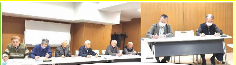
ある日の役員会・打開策検討中