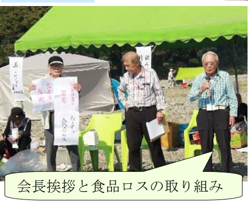
会長挨拶と食品ロスの取り組み