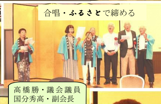
合唱・ふるさとで締める