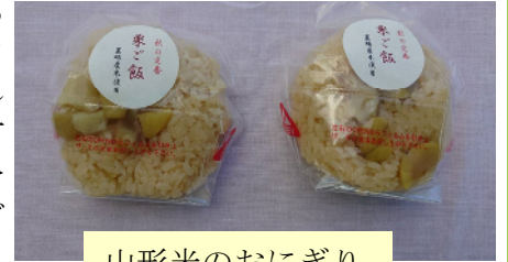
山形米のおにぎり

役員の皆様をはじめ関係者の皆様にはとても感謝しています。年に一度いちご狩りしか会えない友人と今年は三回も会うことができ嬉しさが倍増しました。飯豊町で良い出会いがありました。ありがとうございました。