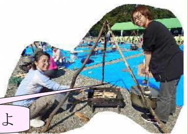
鍋を掛けて準備万端よ

当日は連休中であつたため、会場まで食材を運んでいただく道中も大変な混雑だったとの話を伺っています。食材の準備や運搬、会場の設営に携わった皆様に心よりお礼申し上げます。