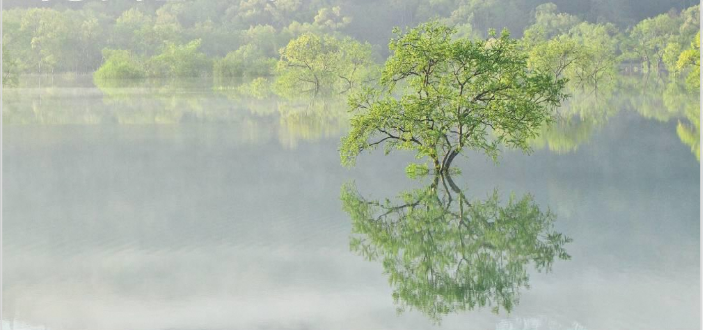
写真: 白川湖の水没林

白川ダム上流の白川湖は春先より雪解け水が流れ込み満水の時期を迎えると新緑のシロヤナギが水につかります。4月中旬頃に姿をみせる水没林は田植えが始まる1ヶ月後には一気に放流され姿を消してしまいます。季節的に湖面に朝もやがかかりやすい時期でもあり、条件が揃えばより幻想的な表情を見ることができます。