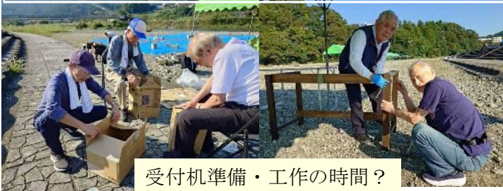
受付機準備・工作の時間？

第7回、飯豊町・東京飯豊会共催大芋煮会が2024年10月13日(日)秋川橋河川敷公園バーベキューランドで開催されました。天候にも恵まれ、町より町長を始め町関係者、JAおきたま、川西会等を含めて約80名の方々に参加して頂きました。今回の芋煮会は約1時間の遅れで始まり、煮上がると待っていましたと一斉に芋煮会が始まりました。参加者の中にはこれを肴に一杯が最高と楽しい会話での風景も、食欲の秋の風物詩になる風景でした。最後に参加者の皆さんに準備や片付け等に協力して頂き楽しい芋煮会が出来ました。(記:深瀬忠次)