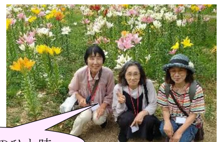
ゆり園散策のひと時

露してくだされ、その後食事となったのですが、今まで元気だった私に異変!! どうやら昼の焼肉の食べ過ぎか? 胃がもたれて目の前のご馳走に手を付けられずで部屋に戻り休むことになってしまいました。同室の方から胃薬をもらい翌朝には復活し朝風呂に入り気持ちよく朝食を美味しく頂く事が出来ました。帰りの道の駅での買い物や食事も楽しめました。全体を通して感じたことは、飯豊会の会長さんはじめ役員の皆さんが今日の日まで色々計画準備して下さったので沢山の楽しい思い出が出来た事に感謝しております。また、車中での飲み物が沢山配られた事にも驚きと、配ってくれた役員さんが元気で素敵でした。ありがとうございました。また、ふるさとにいる方の差し入れや車中で漬物を頂いたり、心が温まり優しさが伝わって来る楽しい旅行でした。飯豊の方達の人柄が最高です。心より感謝申し上げます。