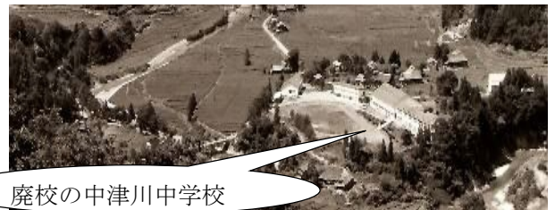
廃校の中津川中学校

ガバチ、ナナセ、オイカワ、鮎、ウナギ、マス、イワナ(川胡桃の葉で揉んで沢に流し捕獲)したものだった。マムシも捕ったナ。春先はヒトド(ホウジロ)田んぼのチョツトだけ雪の消えたところにねじり返しを仕掛ける。あの頃は中々柔らかい網が手に入り難く金網を使ったものだった。秋のキノコ採りは・トビダケ、カノコ、スギワカイ、アカボ、アカモダシ、ホウキタケ、舞茸、松茸、升茸、椎茸、キクラゲ、なめこ、オリミキなど子供の頃の事は沢山浮かぶが、会社に入社してからは社員旅行ぐらいしか思い出せない。最近3日前も思い出せないメモリーが足りないのか、検索機能が悪いのかな? そう思うこの頃です。