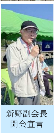
新野副会長 開会宣言