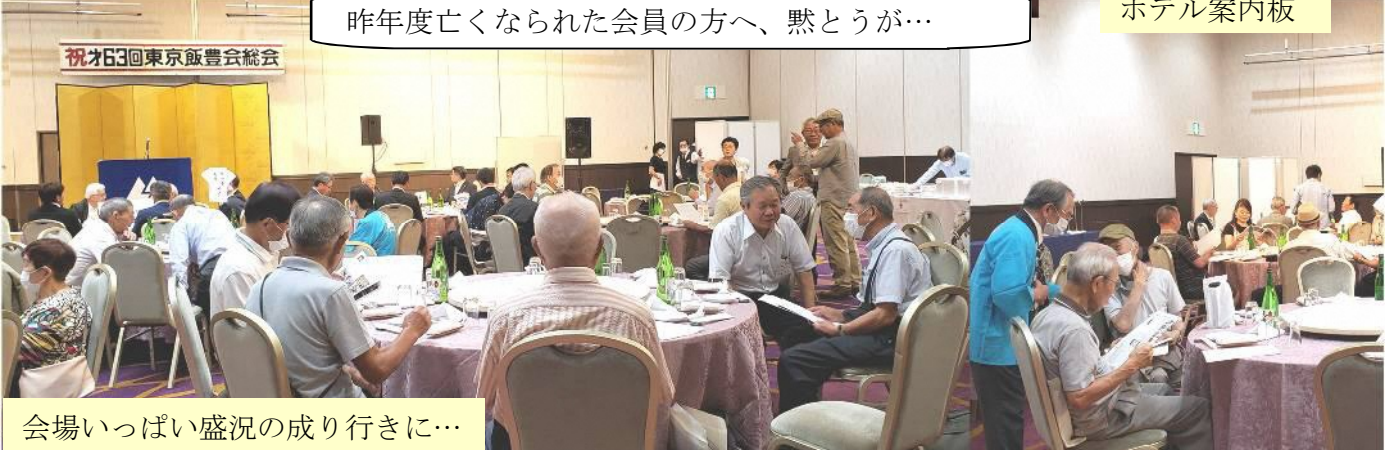
会場いっぱい盛況の成り行きに…