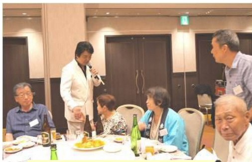
会場を廻り歌を披露!!