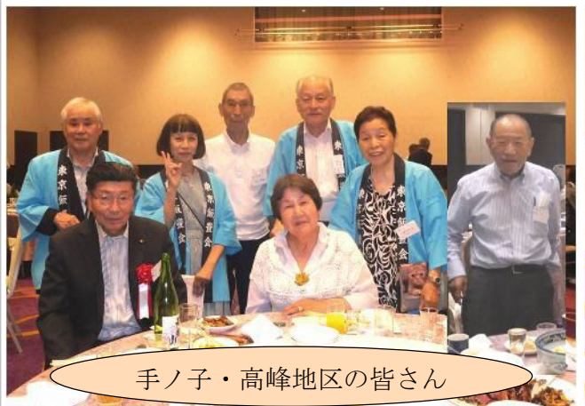
手ノ子・高峰地区の皆さん