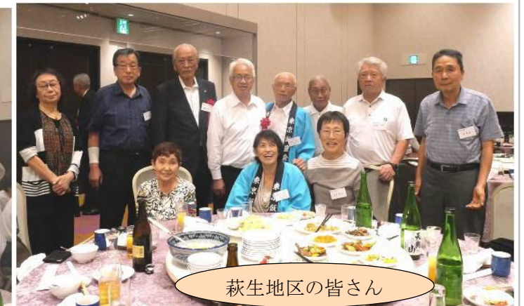
萩生地区の皆さん