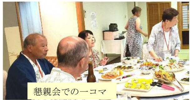
懇親会での一コマ

温暖化の関係でさくらんぼ狩りは中止になりました。残念なことです。やがてラフランス狩りの時代が来るのかな等と余計な事を考えてしまいました。時代は変われども、故郷の訛り懐かし話し声を聞きながら訪ねるバスツアーは最高の行事です。役員の皆様のご苦勞に感謝しながら、次期の開催を待ちたいと思います。いい出会いの旅でした。ありがとうございました。