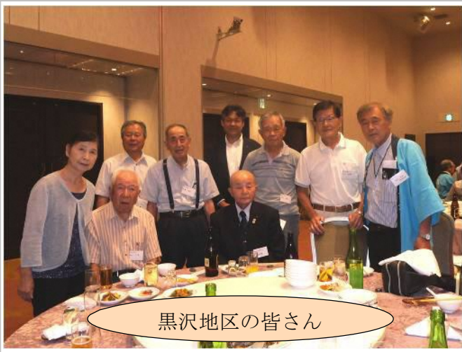
黒沢地区の皆さん