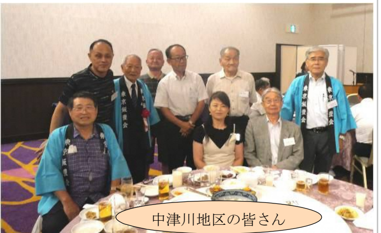
中津川地区の皆さん