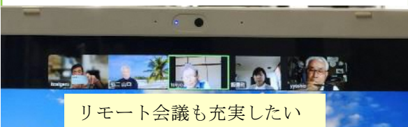
リモート会議も充実したい