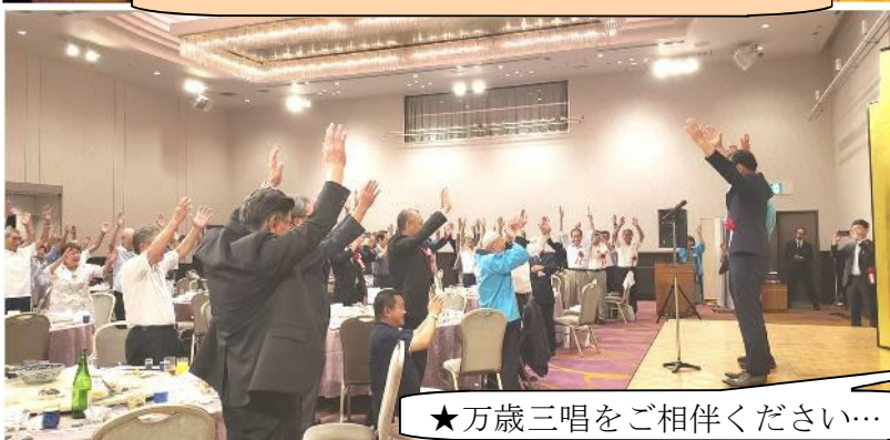
★万歳三唱をご相伴ください…