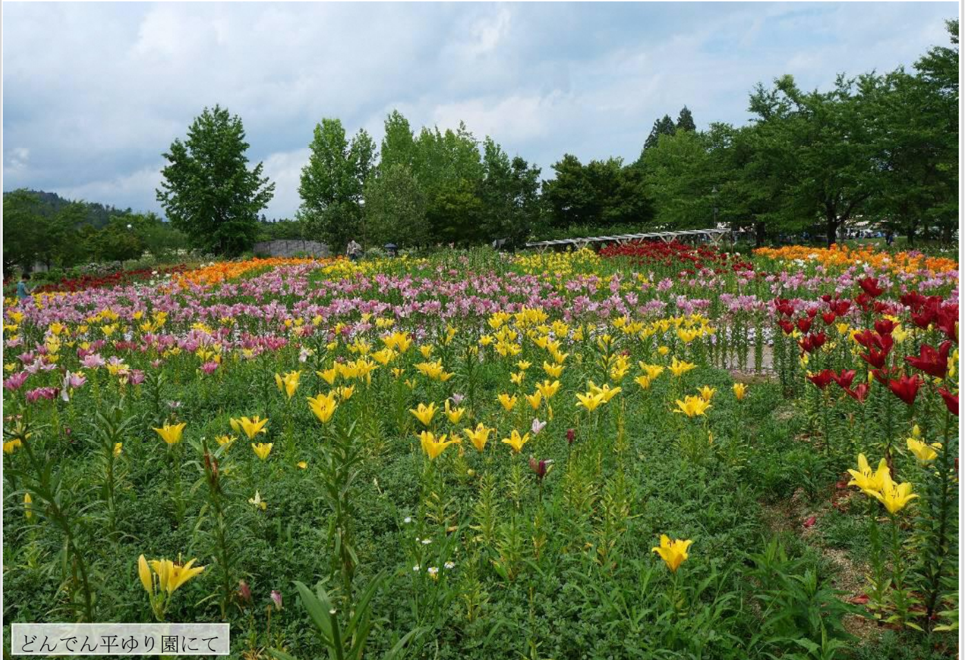
どんでん平ゆり園にて