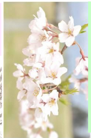
ふるさと桜だより