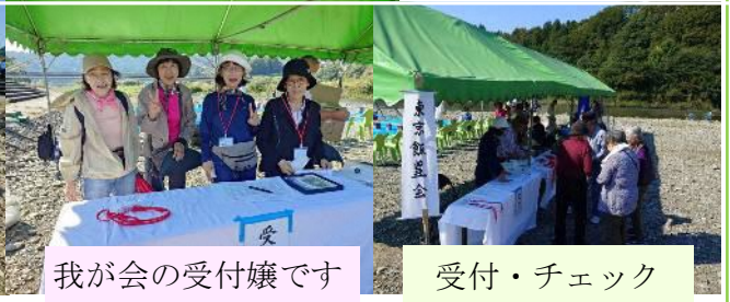
我が会の受付嬢です