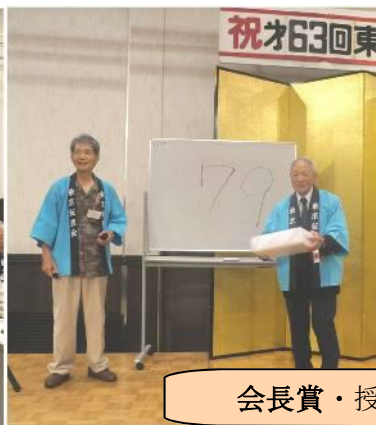
会長賞・授与する!!