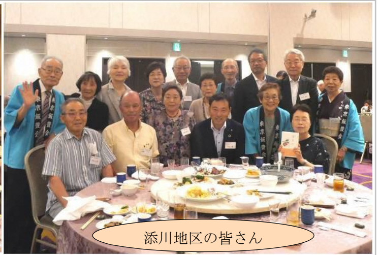
添川地区の皆さん