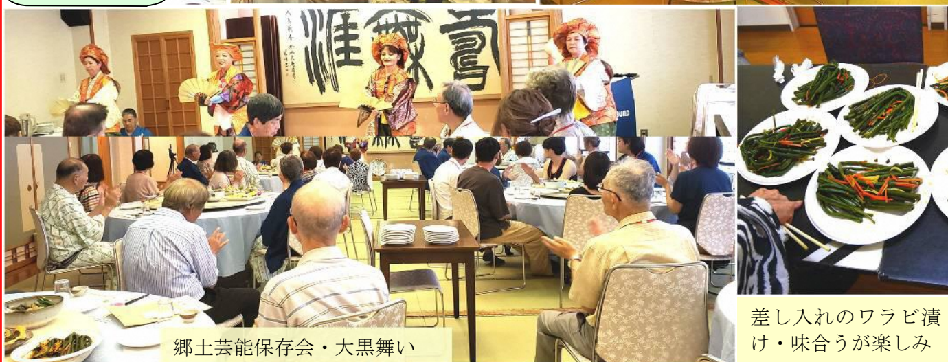
郷土芸能保存会・大黒舞い