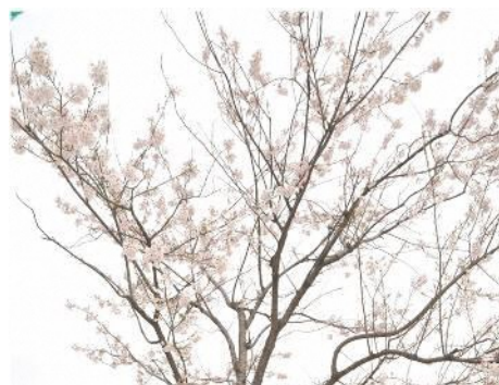
飯豊町立第一小学校校庭にて

★会員の皆様のご賛同により 2017年秋、植樹しました桜の木が毎年花を咲かせて…、子供たちの遺産となる事を願っています。