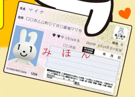
マイナンバーPR キャラクター マイナちゃん

町内にある企業や事業所、団体などを対象に役場住民課職員が職場や会場に訪問してマイナンバーカードの申請受付をします。町外に在住する従業員や、従業員のご家族なども申請を受け付けますので、この機会にぜひマイナンバーカードを申請してください。 5名以上から受け付け ます。