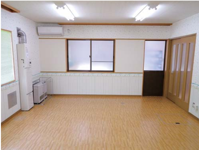
要望にこたえ乳児(0歳～2歳児)棟の拡充