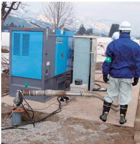
おいしく安全な水道水を

答 現在、第6期計画策定中であり、地域の意見や町の施策を計画の中に盛り込んでいきます。