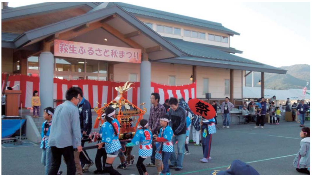
地域の力で「ふるさと、祭り

を反映させたプラン作成に努めていきます。消費者との信託制度、各生産小集団の強化、そして若い農業者を含めた未来塾の創生等、示唆に富んだ提案がありますので、将来へ向けたプランとしていきます。