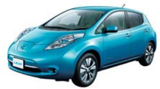
リチウムイオン電池自動車

なお、補正予算に対し、議員発議により附帯決議が提出され、賛成多数により可決されました。