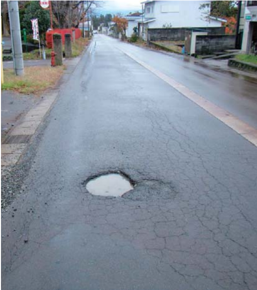
町民の要望に応え補修を