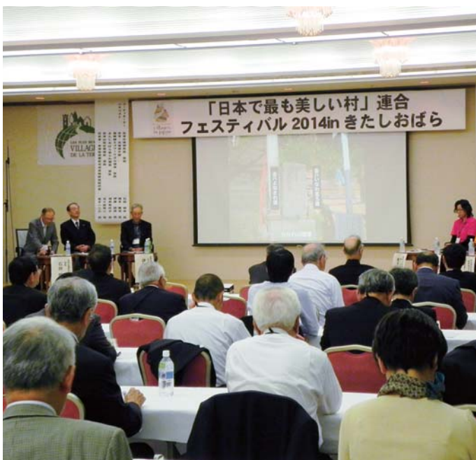
新しい仲間が増えました（一町一村）

「日本で最も美しい村」連合の、2014フェスティバルinきたしおぼらに出席してきました。 連合は、新たな「地域の星」を目指して、平成17年に設立、北海道から沖縄まで、全国55町村（一部地域含）で構成されています。 東北では大蔵村について 2回目の開催で、ヨーロッパに根づいたまちづくり、そこで暮らす人々の幸福度向上のための取り組みを参加自治体で実践していました。 原発の風評被害を払拭できるよう、福島の大観光地である裏磐梯高原で開催されました。