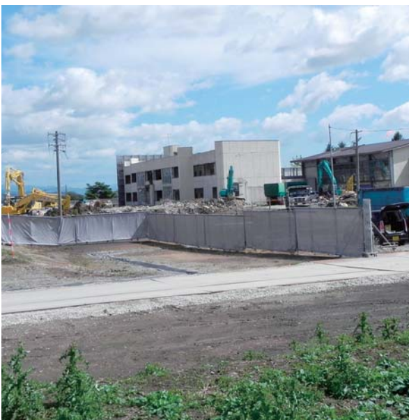
解体される第一小

答 建物の解体、整地が完了します。9月末で東芝ライテック(土地所有者)より無償譲渡され、所有権移転の手続きをします。