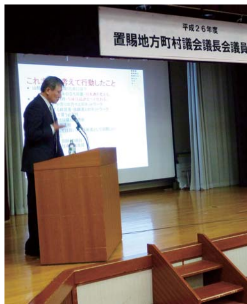
うまい酒への期待も