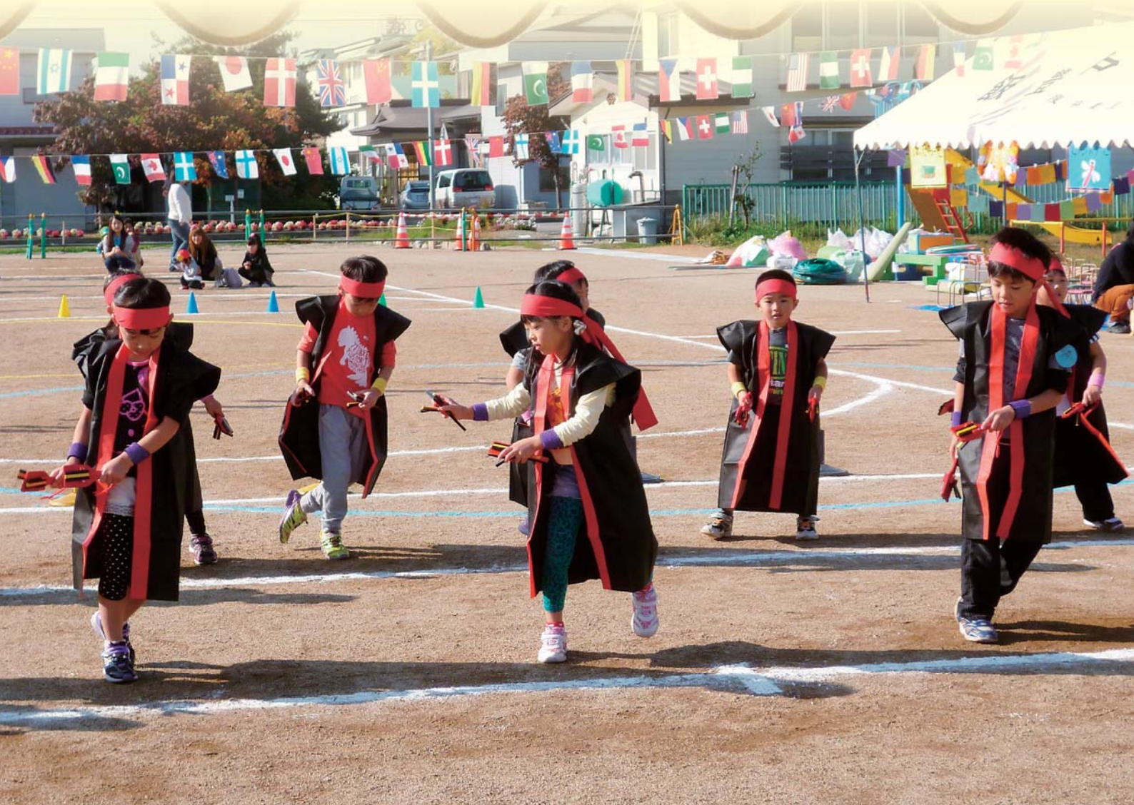
広くなった園庭で笑顔がいっぱい（つばき保育園）