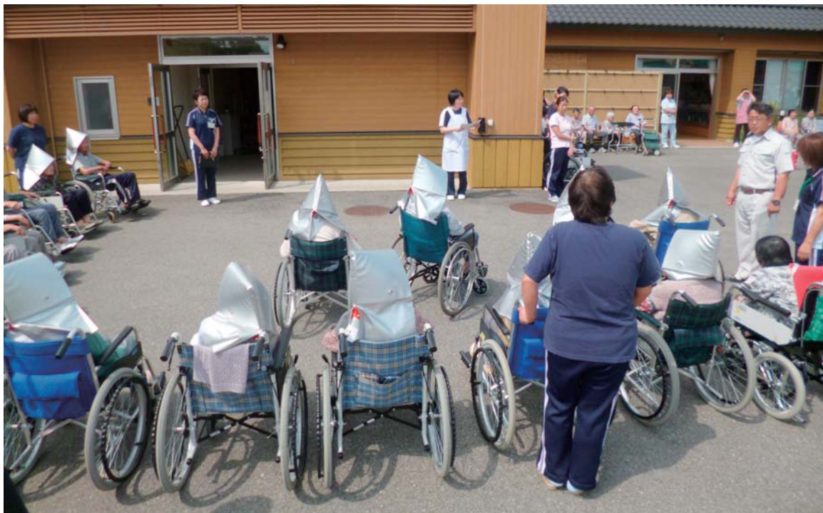
自助、共助、公助（大災害を想定した避難訓練 みのり）