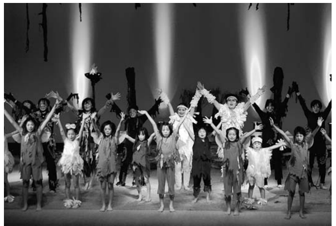
めざみキッズによる創作ミュージカル「獅子の笛」の場面。めざみキッズでは、年に数回、プロの講師による指導もあります