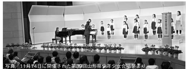
写真／11月14日に開催された第39回山形県少年少女合唱祭より