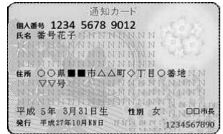
▲マイナンバー通知カードのみほん