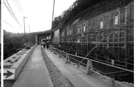
山側擁壁の鉄筋組立中