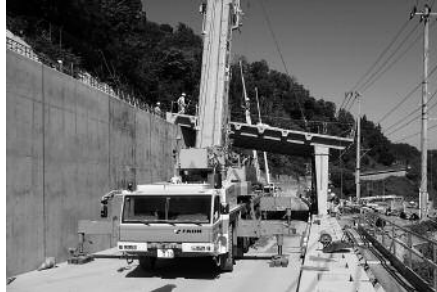
100tクレーンによる上部工架設中

なお、架設作業時の全面通行止めは、8：00～17：00のみで夜間は片側交互通行となります。片側交互通行期間でも、工事区間であり機械や作業員の往来もありますので、十分に注意して通行されるようお願いいたします。また、通行の安全を確保するため、やむを得ず一時的（数分間）に通行できない時間も生じますが、皆さまのご理解とご協力をよろしくお願ひします。