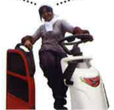
▲ 協力隊経験者の声

やりたいことがないのにお金を稼ぐためだけに就職することに疑問を感じて参加を決めた。(大学生・女性)