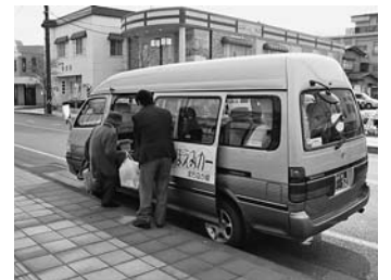
通院・買い物に便利なほほえみカー

※町では運転免許証を自主返納された方に、返納時に「ほほえみカー回数券」を無料配布しています