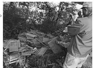
※飯豊橋真下に捨てられた大量の育苗箱